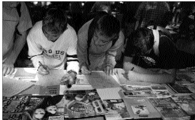
Angehende Chemieprofessoren, Ritter und Baggerführer füllen am Stand der Psychologischen Beratungsstelle ihre Fragebögen aus.

13 Jahren aufwärts überwogen pflegerische und soziale Berufe wie Krankenschwester, Ärztin oder Erzieherin. Aber auch einige Hotelfachfrauen und kaufmännische Angestellte waren dabei. Bei den Jungen in diesem Alter lagen die Fußballer, die Polizisten und die Handwerker einsam an der Spitze. Herausragend war allerdings der 16-jährige »Pfarrer«, seine drei Wünsche für die Zukunft: »Bischoff, Kardinal, Papst«!