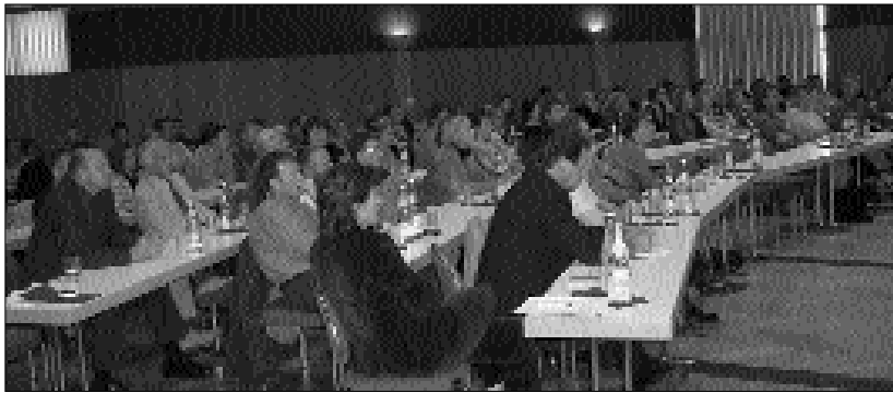
Mit rund 120 Besuchern war der Bürgersaal des Helmbrechtser Rathauses bei der Fachtagung gut besucht. Ergebnis: »Die Bildung regionaler Netzwerke ist eine echte Alternative zu Konzentrationsprozessen.«