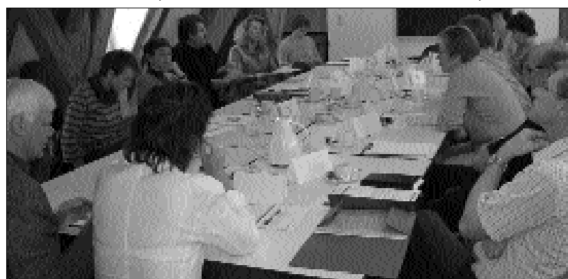
In der ersten M-8-Konferenz wurde nach Wünschen und Erwartungen der beteiligten Träger und Einrichtungen gefragt. Alle erklärten sich zu einer intensiven Zusammenarbeit bereit.

henden Einrichtungen neue Räume in bester Lage, kann aber mit einer Empfangsdame nicht dienen. Im Vergleich zu den Chancen, die dieses Projekt bietet, ist dies nur ein kleiner Wermutstropfen. ed