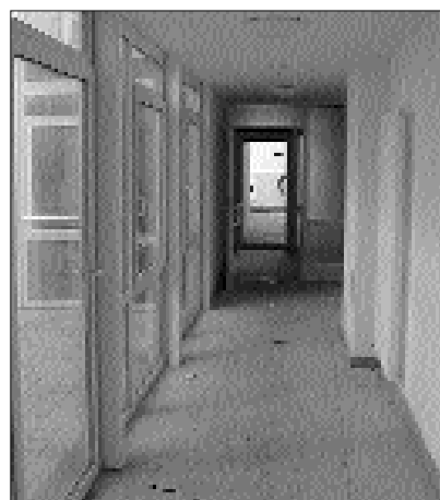
Ein Unterschied - im wahrsten Sinne des Wortes - wie Tag und Nacht. Insgesamt sechs Millionen Euro werden in die drei Umbauten investiert.