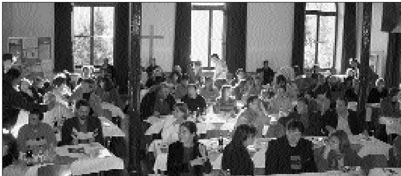
Die Landesfachtagung des Evangelischen Erziehungsverbandes Bayern fand dieses Jahr in Schwarzenbach Saale statt. Vortrag und Workshops waren - unter anderem von Mitarbeitenden der Diakonie Hof - gut besucht.