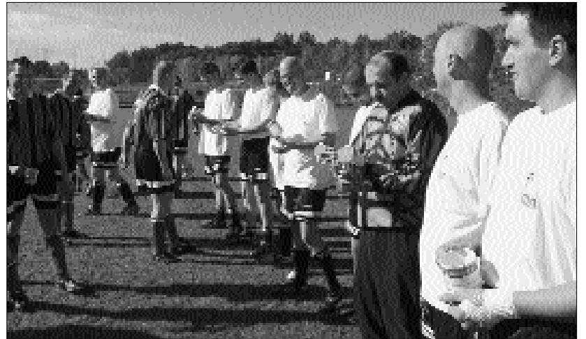
Freundschaftliche Begegnungen auf und am Rande des Spielfeldes machen die Diakonie-Fußballspiele zu einer nicht nur sportlich sondern auch menschlich gelungenen Sache. Das Hofer Team brachte Diakonie-Tassen als Gastgeschenke mit.

Aber das Ergebnis war bereits beim anschließenden gemütlichen Beisammensein nicht mehr wichtig. Hier wurde ein Rückspiel für 2004 in Hof vereinbart und auch die Teilnahme beim Diakoniecup im März steht bereits fest.