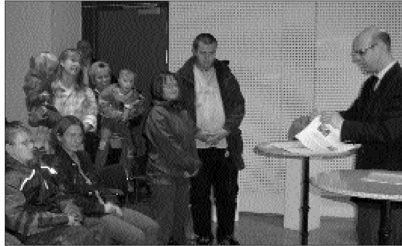
An der Preisverleihung in der Geschäftsstelle des Diakonischen Werks Bayern in Nürnberg nahmen Mitarbeiter und Kinder aus dem Hofer TPZ teil. Die Einrichtung freut sich über einen dritten Preis im bayernweiten Wettbewerb »Wir helfen Menschen mit Behinderung«.

dem Thema Integration und Kooperation. Die Einrichtung (TPZ) ist durch die vielen bunten »Mosaiksteinchen« mehr als die Summe dieser Angebote. Es gibt im TPZ keine in sich abgeschlossene Welt, sondern letztlich ist die Einrichtung inzwischen ein reales Abbild der Gesellschaft. Alle angebotenen Gruppen werden von den Eltern stark nachgefragt.