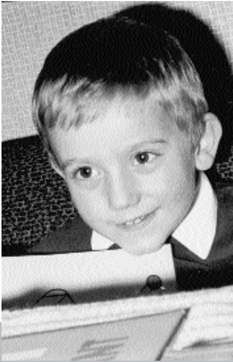
► Stiftung Marienberg