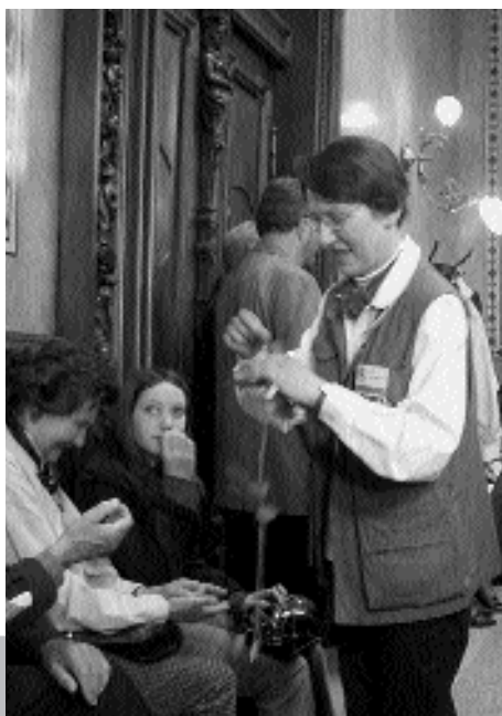
► Beim Gottesdienst im Königssaal

Den Partnern gelang es zu zeigen, wie in Hof zu Gunsten der Menschen an einem Strang gezogen wird.