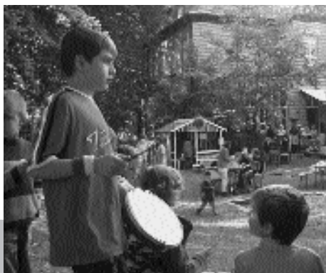
► Frühlingsfest am Schellenberg

Zu einem erlebnisreichen Frühlingsfest haben sich Kinder, Eltern und Team des Kindergartens am Schellenberg getroffen. Der Nachmittag stand ganz im Zeichen von Kreativität, Spaß und Naturerfahrung. In dem großen Garten rund um die alte Villa erwarteten lauschige Sitzplätze und anregende Workshops die kleinen und großen Gäste. Da das Wetter gut mitspielte, konnte fast alles unter freiem Himmel über die Bühne gehen.