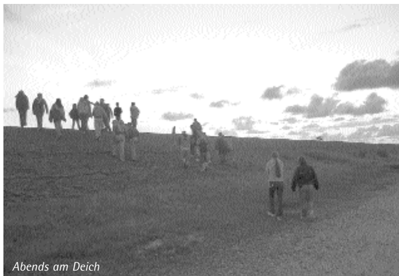
Abends am Deich

Alle up with friends -Reisen entsprechen den »GutDrauf« Standards der Bundeszentrale für gesundheitliche Aufklärung. Das Projekt sensibilisiert und motiviert Kinder und Jugendliche für die Themen »Ernährung«, »Bewegung« und »Entspannung«. So soll Essen positiv