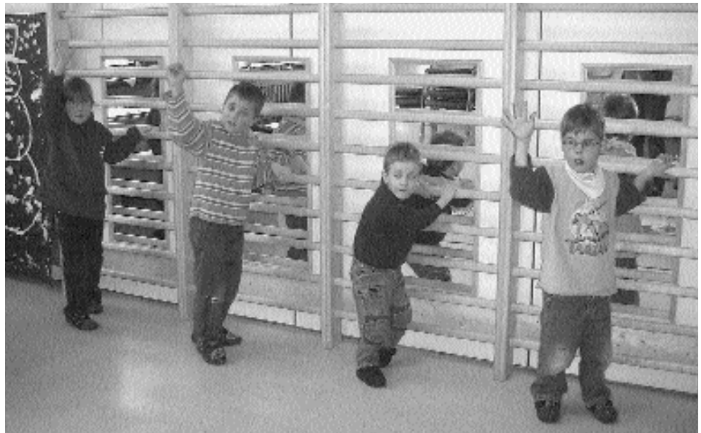
Auf Pritschen und anderen praktischen Therapiemöbeln werden die Kinder von zwei »Konduktorinnen« in ihrem Bewegungsverhalten, aber auch in Sprache, Wahrnehmung und Kognition trainiert.

Die Kinder treffen sich nachmittags im »Pető-Raum«, der mit vielen speziellen so genannten Pető-Möbeln ausgestattet ist. Auf Pritschen, Sprossenwänden, Leiterstühlen und anderen praktischen Therapiemöbeln werden sie von ihren zwei »Konduktorinnen«, die im Grundberuf Erzieherin bzw. Physio-