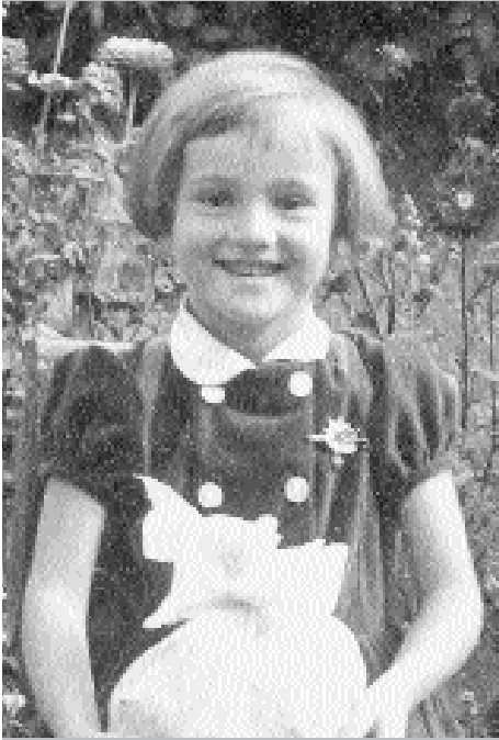
▶ Diakonie Hochfranken