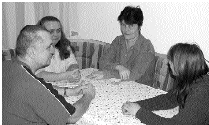
Geborgenheit, Kontakte und ein alltägliches Miteinander bietet die neue Gemeinschaft des Betreuten Wohnens in der Hofer Auguststraße.

Im sozialen Lernfeld »Wohngemeinschaft« können sich die einzelnen Mitbewohner mit ihren individuellen Fähig- und Fertigkeiten ergänzen und so Defizite ausgleichen, was zur psychischen Stabilisierung beiträgt und so die Lebensqualität steigert. Zudem durchbricht die Wohngemeinschaft die bei unserem Klientel so häufige Tendenz zur sozialen Isolation und bietet ein geborgenes Zuhause.