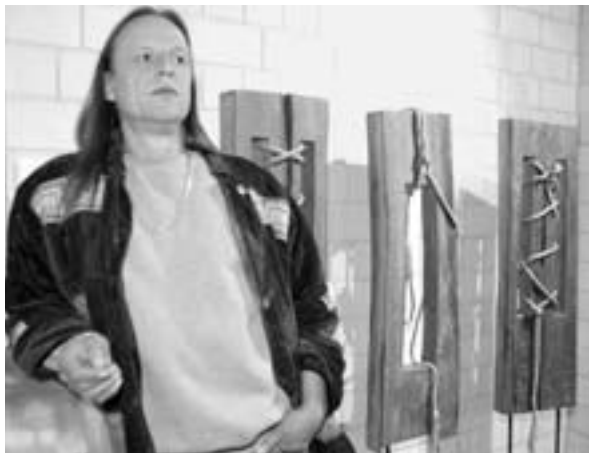
Das Ende des Kapitalismus kommentiert Strobel mit diesem dreiteiligen Werk aus seiner jüngsten Schaffensperiode.