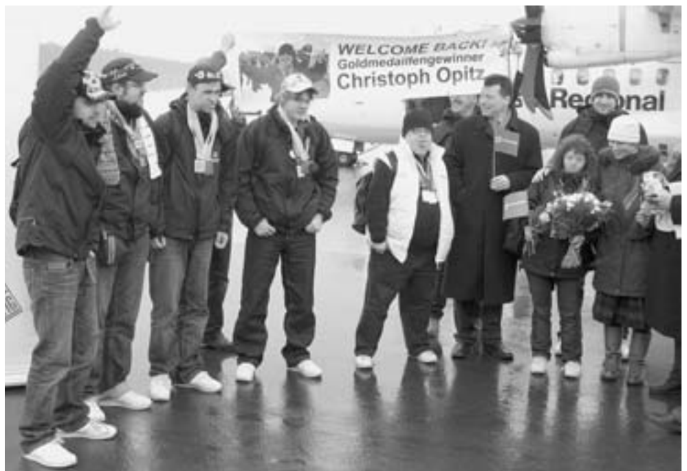
Das erfolgreiche Hofer Team wird am Flughafen in Empfang genommen.