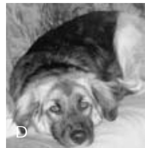
D Hund auf Sofa LUNA