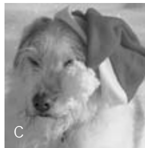
C Hund im Schnee WINNIE