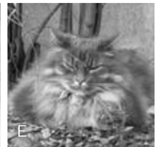
E Langhaar-Katze LOLA

Die Auflösung des Rätsels steht auf Seite 12