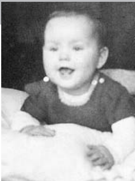
▶ Diakonie Hochfranken